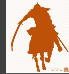
Omar Ibn Saad