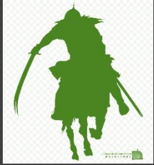
Hurr bin Yazid Riyyahi